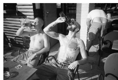
3. netko (nešto) s nekim (nečim)