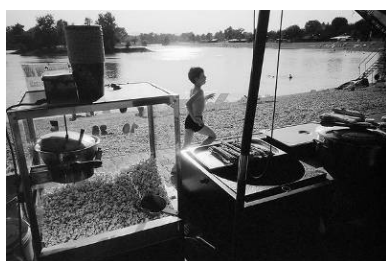
1. klasična sačekuša

Za one koji se možda snebivaju nad mojim nešto "žešćim" riječnikom u ovoj bilješci, stvar je vrlo jednostavna. Pišem o ulici a ulica, baš kao i ulična fotografija, nije akademski obrazovana niti trpi mimoze, naročito ne mimoze od fotografa jer na ulici se svaki pravi pravcati uličar susreće sa puno toga; sa tugom, srećom, smijehom, veseljem, ludilom, grubošću, svakojakim ljudskim sranjima, katkada i konfliktima, opačinama pa i smrću... ili da skratim, sa životom. A ulična fotografija je upravo to. Esencija života u jednoj jedinoj slici koja će svakog pravog pravcatog uličara natjerati da mu srce brže zakuca i da sudjeluje u njemu.