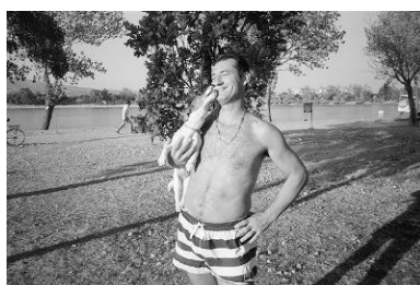
2. jedan na jedan ili šut u bulju